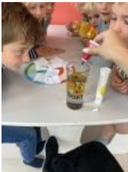
Bilde: Vi undrer oss sammen med barna