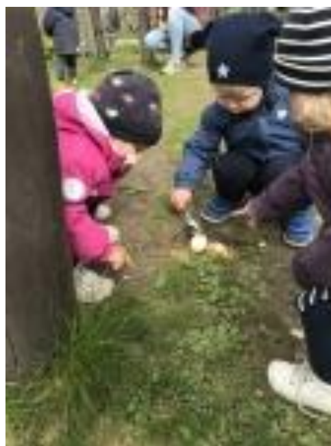
Bilde: Et knust egg skaper mye undring for de minste!