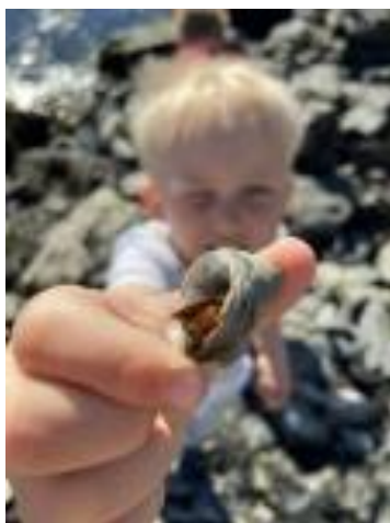
Bilde: Vi finner mye spennende når vi er på tur!

Annen viktig informasjon: Nysgjerrighet og interessere for å lære. Håndtering av utfordringer og nye oppgavetyper. Konsentrasjonsevne, utholdenhet, oppmerksomhet (hvor lenge?). Gleder / gruer seg til skolestart (evt. årsaker). Blyantgrep.