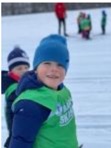
Bilde: Vi er glade i å være ute, og skiskolen er en stor begivenhet for de største.

Fagområdene gjenspeiler områder som har interesse og egenverdi for barn i barnehagealder, og skal bidra til å fremme trivsel, allsidig utvikling og helse. Barnehagen skal se fagområdene i sammenheng, og alle fagområdene skal være en gjennomgående del av barnehagens innhold. Barna skal utvikle kunnskaper og ferdigheter innenfor alle fagområder gjennom undring, utforskning og skapende aktiviteter.