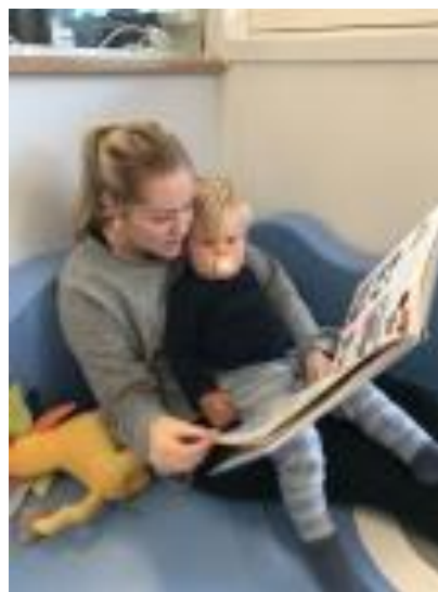
Bilde: Lesestund på avd. Ludvig