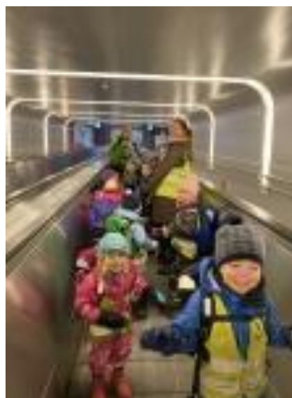
Bilde: Godt samhold på spennende tur til Oslo