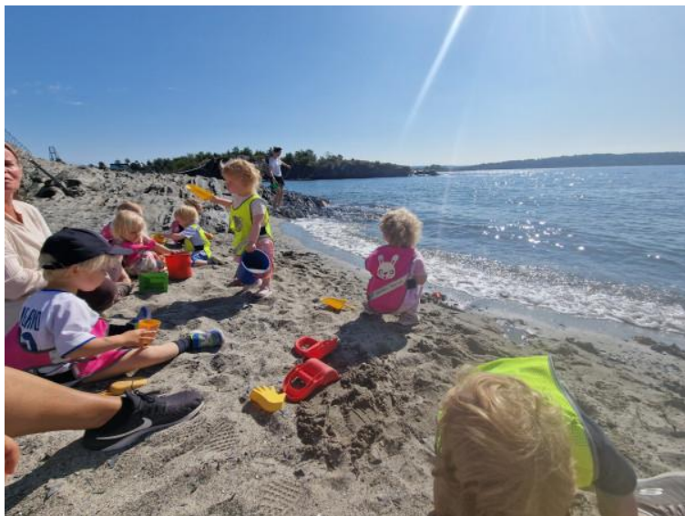
Bilde: Barn og voksne på avdeling Ludvig på tur til stranden i vårt nærmiljø