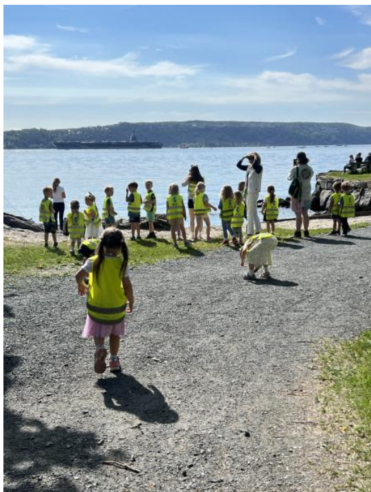
Bilde: Verdens største krigsskip seiler forbi!