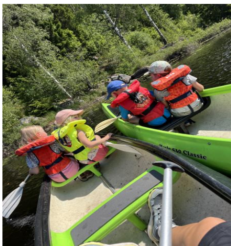
Bilde: Førskolebarn på tur til Vangen 2023

Alle barn i barnehagen skal oppleve progresjon i barnehagens innhold, gjennom å utvikle seg, lære og oppleve fremgang. For å sikre progresjonen i alle aldersgrupper, har vi stort fokus på det vi omtaler som «lekegrupper». Vi deler barna inne i mindre grupper, med én voksen per gruppe. Gruppene deles inn basert på alder, men også på tvers. Aktivitetene kan være styrt av voksen, mens andre ganger får barna velge selv. Vi har stort fokus på at barna skal få utfordringer tilpasset sine erfaringer, interesser, kunnskaper og ferdigheter, og mener at lekegruppene gir et godt utgangspunkt.