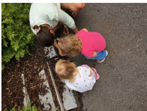
Bilde: Deltakende voksne sammen med barna

Kompetanseheving handler for oss om å utvikle kompetanse til å bli autoritative voksne, definert som varme og grensesettende voksne. Voksne som er varme grensesettere er: Tydelige, rolige og kontrollerte. De er klar over hvilken effekt stemmebruken har. De voksne er imøtekommende overfor barn/voksne og gir respons. De voksne oppleves som nære og barna blir tatt på alvor. Voksne som viser varme i relasjoner er: Til stede og bevisst sin stemmebruk og sitt blikk. De har et varmt kroppsspråk, viser oppriktig interesse for barnet og stiller spørsmål, er ekte og lyttende.