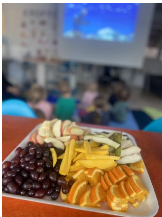
Bilde: Vi er opptatt av sunt og variert kosthold