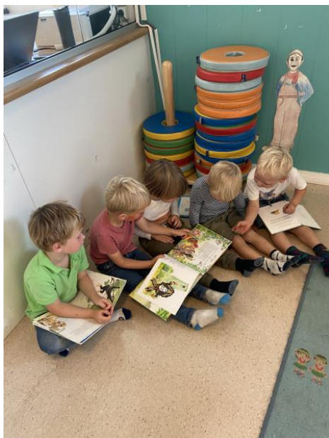
Bilde: Barna leser på avd. Reodor Felgen